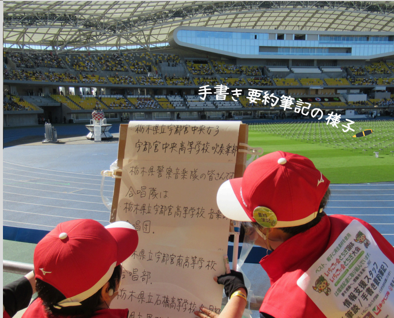
手書き要約筆記の様子