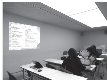
▲パソコンで入力した文章を確認中