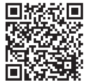
▲要約筆記者養成講習会 募集チラシ+申込書